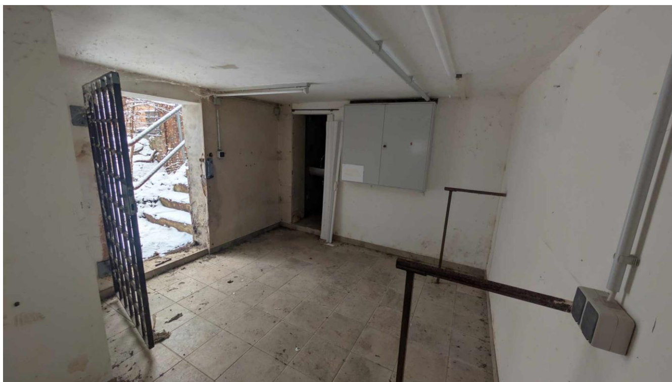
Keller Raum 1