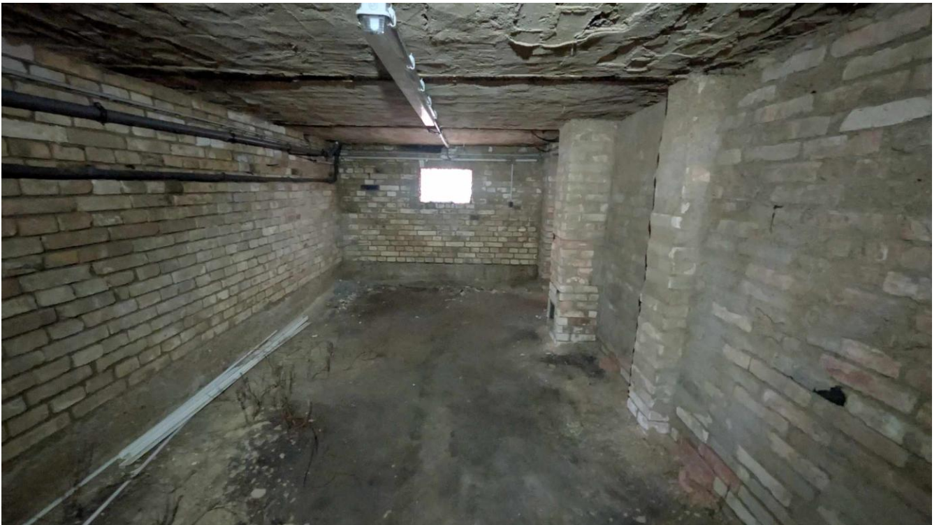
Keller Raum 3