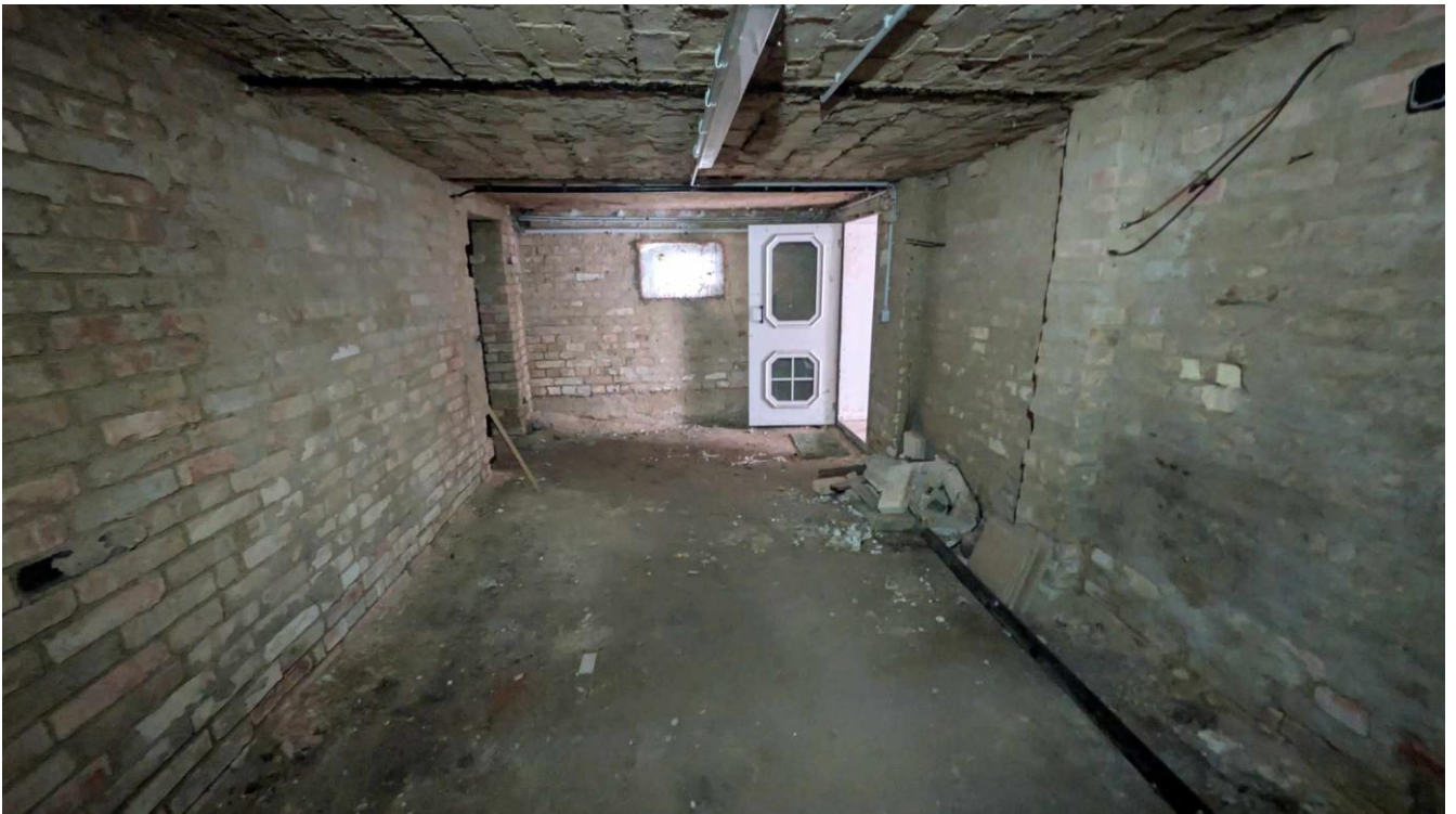
Keller Raum 2