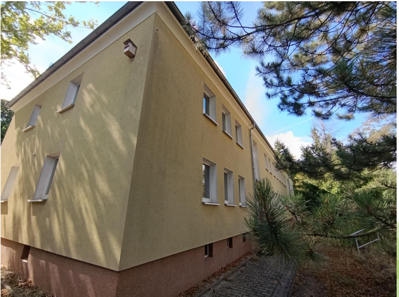
Saalberg 1, 06193 Wettin-Löbejün OT Rothenburg