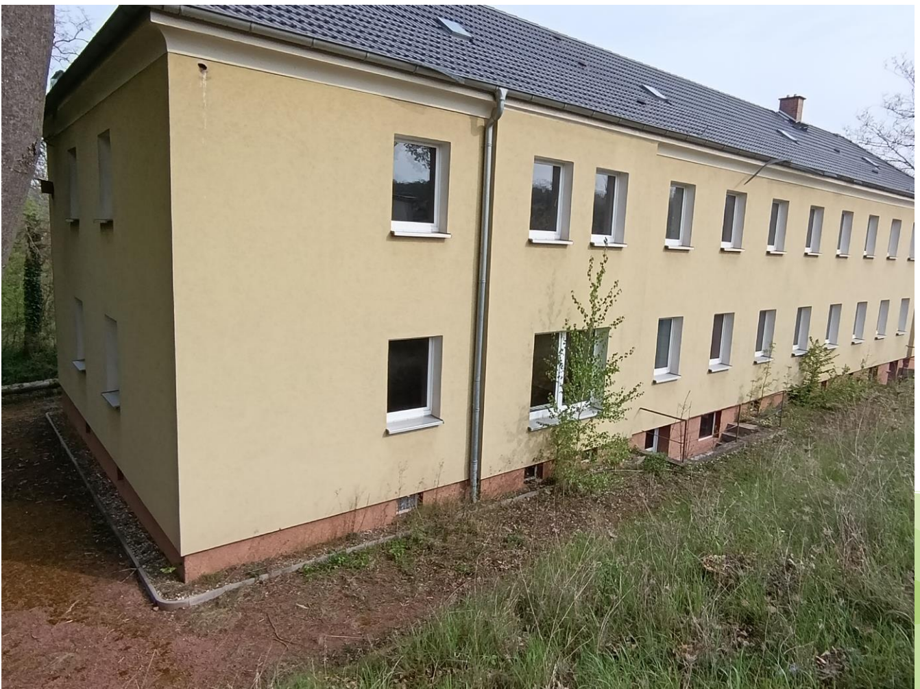
Pappelstraße 2, 06193 Wettin-Löbejün OT Rothenburg