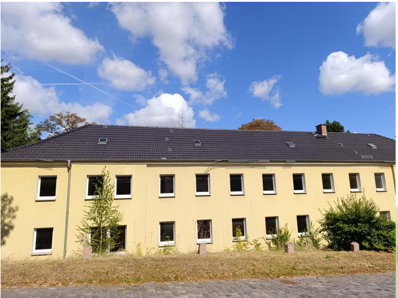
Saalberg 1-2, 06193 Wettin-Löbejün OT Rothenburg

OT Rothenburg Saalberg 1 – 2 06193 Wettin-Löbejün