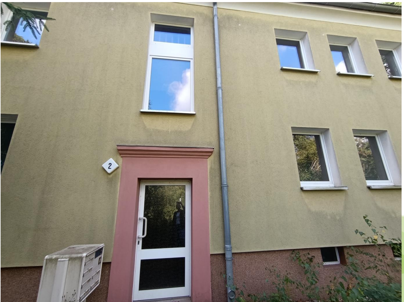
Pappelstraße 2, 06193 Wettin-Löbejün, OT Rothenburg