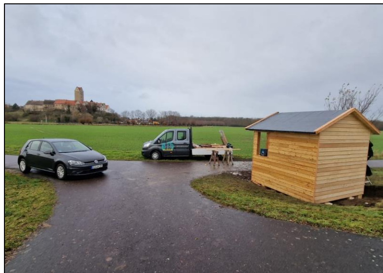
Aufbau der Schutzhütte am Standort Plötzkau

Ende des letzten Jahres wurde die mit Landesmitteln zur Umsetzung unserer Pflege- und Entwicklungskonzeption finanzierte Schutzhütte für den Standort Plötzkau durch eine im Naturpark ansässige Holzbaufirma aufgebaut. Mit ihrer Lage direkt am Saaleradweg und der Nähe zum dortigen Wanderparkplatz stellt die Schutzhütte eine gute Ergänzung der touristischen Infrastruktur dar.