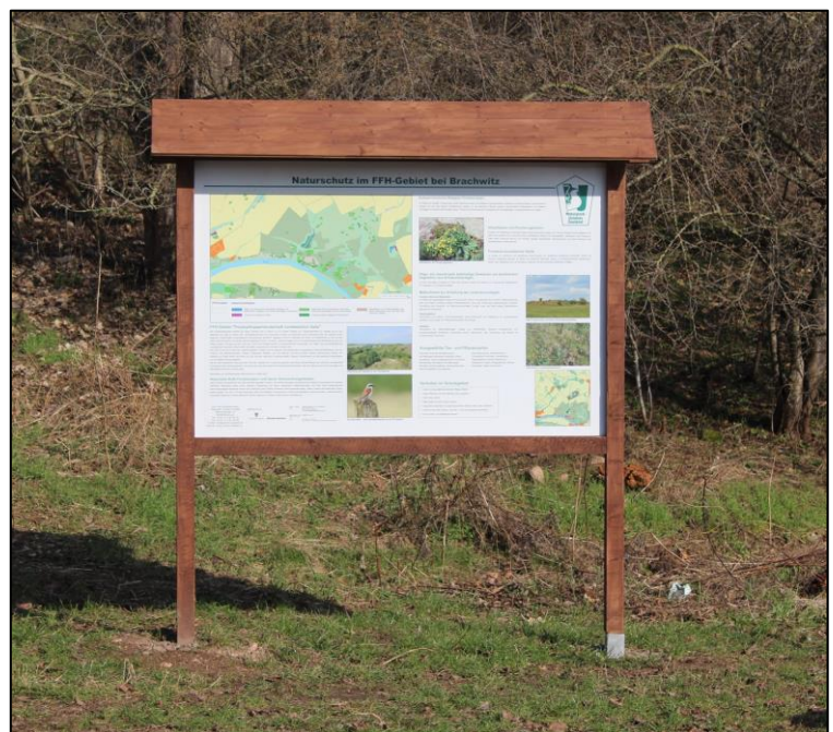
Infotafel am Saalekiez