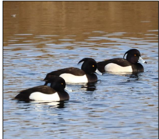
Reiherenten bei Plötzkau

Bei Plötzkau wurden von einem Praktikanten unseres Naturparks Reiherenten (Aythya fuligula) fotografiert. Die zu den so genannten Tauchenten zählende Art ist in Mitteleuropa ein verbreiteter Brut- und Jahresvogel. Als Besonderheit besitzen die Männchen am Hinterkopf einen langen, herabhängenden Schopf, ähnlich einem Reiher. Die Reiherenten breiten sich zunehmend nach Westen aus und ihre Population ist im Ansteigen begriffen. Im Winter sind besonders viele zu beobachten, da dann zusätzlich weitere Exemplare zum Überwintern zu uns kommen.